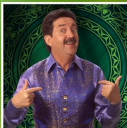
George Casey Irish Comedian "The King Of Blarney"