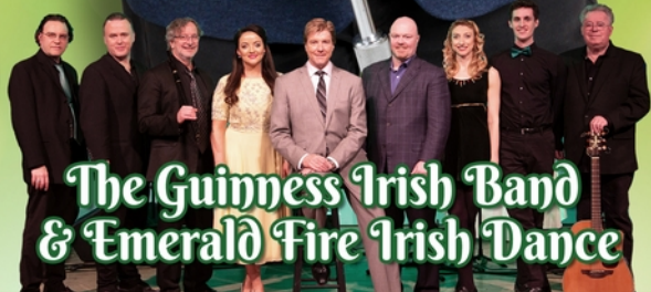
The Guinness Irish Band & Emerald Fire Irish Dance